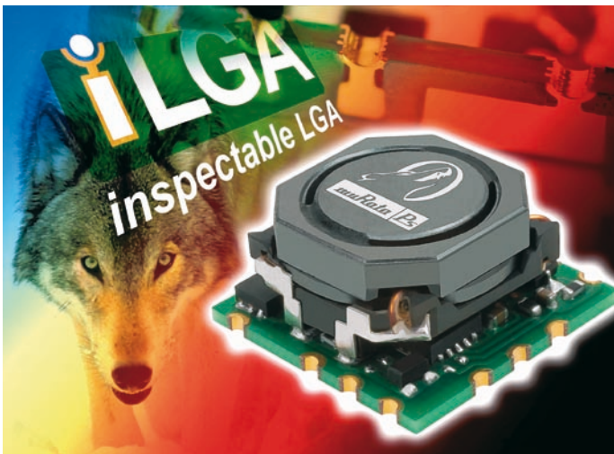
PoL-DC/DC-Leistungswandler «Okami OKL» von Murata Power Solutions

Der Einsatz von PoL-Modulen (Point-of-Load) stieg in den letzten Jahren stetig an. Der Grund – es gibt immer mehr Anbieter, die Produkte bereitstellen, mit denen sich die Stromversorgungsanforderungen der Kunden zu wettbewerbsfähigen Preisen verwirklichen lassen.